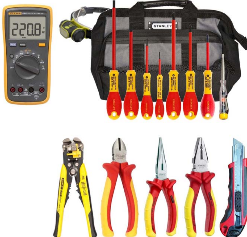
Набор СвязьКомплект SK-16 B2