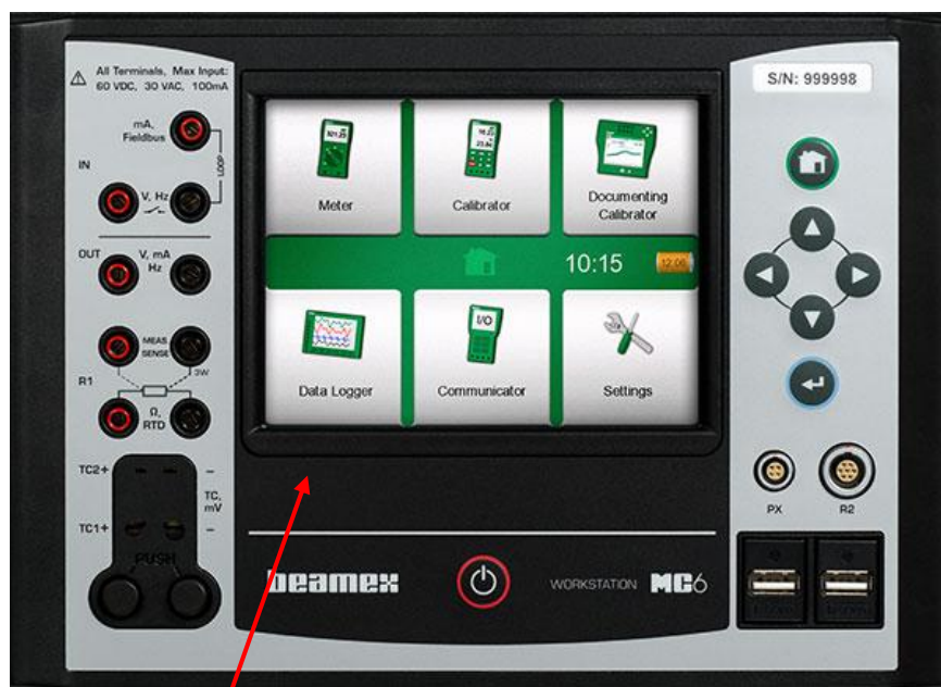
Место нанесения знака поверки