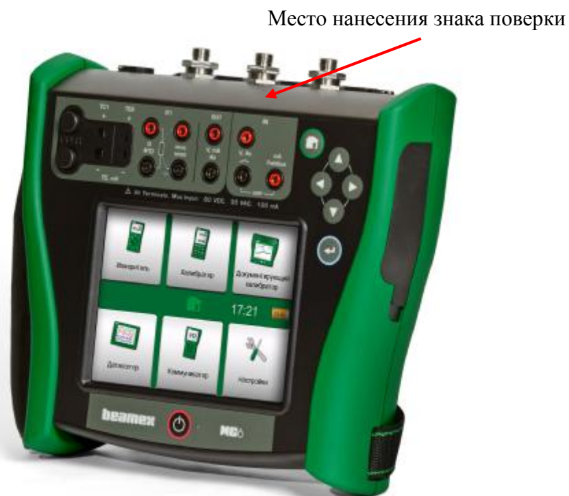
Рисунок 1 – Общий вид калибратора BEAMEX MC6 (-R) с указанием места нанесения знака поверки